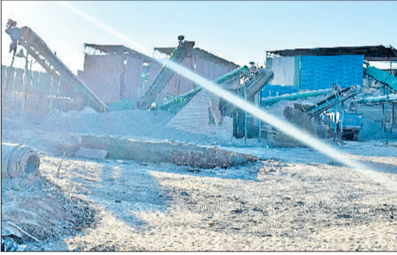
तोशाम। खनन नगरी गांव खानक में बंद पड़ी क्रेशर इकाई।

दिल्ली-एनसीआर में बढ़ते वायु प्रदूषण के स्तर के कारण पिछले कई दिनों से लागू ग्रेप के चलते तोशाम क्षेत्र में हजारों लोगों की रोजी-रोटी का माध्यम खनन कार्य बंद पड़ा है। जिसके चलते क्षेत्र के पहाड़ों पर खामोशी छाई हुई है और बाजार में भवन निर्माण सामग्री के दाम आसमान छू रहे हैं। ऐसे में खनन के माध्यम से अपनी रोजी-रोटी चलाने वाले लोगों के लिए मुसीबत बनी हुई है और हजारों