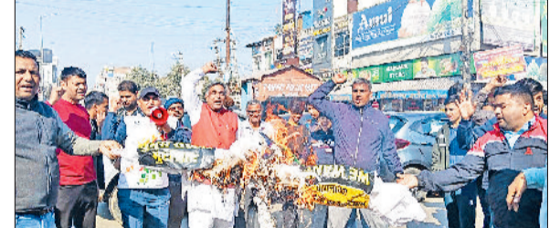
भिवानी। हांसी चौक पर बांग्लादेश की युनुस सरकार का पुतला फूँकते विहिप व बजरंग दल के कार्यकर्ता।