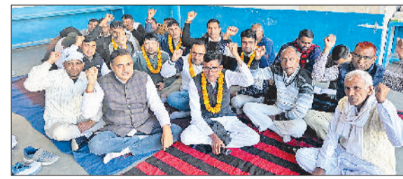
चरखी दादरी। तबादला नीति रद्द करवाने व आठवें वेतन आयोग गठन को लेकर नारेबाजी करते कर्मचारी।