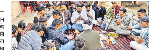
भिवानी। सदबुद्धि आने को लेकर आयोजित हवन में आहुति डालते हुए।