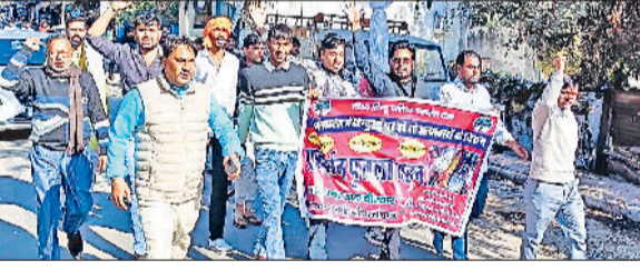
लोहारू। लोहारू करबे में जुलूस निकालते हुए।