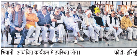
भिवानी। आयोजित कार्यक्रम में उपस्थित लोग।