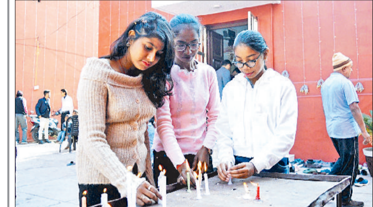
मिवाणी। बैपटिस्ट चर्च में प्रभु यीशु मसीह के याद में कैंडल जलाती क्रिसमस तथा प्रार्थना सभा में मौजूद क्रिसमस समाज के लोग।