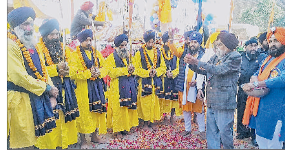
भिवानी। दशमेश पिताश्री गुरु गोबिंद सिंह के प्रकाश पर्व पर निकाली गई शोभायात्रा में शामिल पंजावारे व अन्य श्रद्धालु व शोभायात्रा में हैरत अमेज करतब दिखाते पंजाब के संगरूर से पहुंचे अकाल गतका ग्रुप के कुशल गुरसिख।