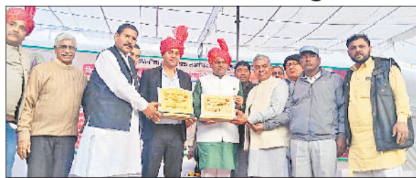
भिवानी। आयोजित सांग में मुख्यअतिथि को सम्मानित करते हुए।