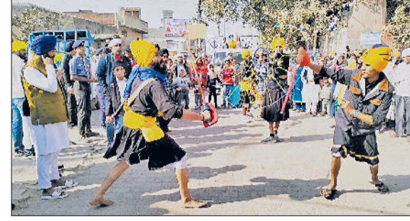
भिवानी। दशमेश पिताश्री गुरु गोबिंद सिंह के प्रकाश पर्व पर निकाली गई शोभायात्रा में शामिल पंजावारे व अन्य श्रद्धालु व शोभायात्रा में हैरत अमेज करतब दिखाते पंजाब के संगरूर से पहुंचे अकाल गतका ग्रुप के कुशल गुरसिख।

में संपन्न हुआ। इस दौरान संगत ने गुरु कीर्तन, शब्द-कीर्तन और धार्मिक जयकारों के साथ नगर कीर्तन में सहभागिता की। शोभायात्रा में श्रीगुरु ग्रंथ साहिबजी को फूलों से सजी भव्य पालकी में विराजमान कर शहर के मुख्य बाजारों में संगत के दर्शाना ले जाया गया। गुरु के खालसा स्वरूप में पंच प्यारों ने नंगी तलवारें हाथों में लेकर श्रीगुरु ग्रंथ साहिबजी की अगुवाई की। वहीं दस गुरु साहिबान की बड़ी बड़ी प्रतियां को अलग अलग छोड़ा पालकी में सजाया। पंच प्यारों के आगे महिलाओं ने झाड़ू से मार्ग की सफाई कर जल